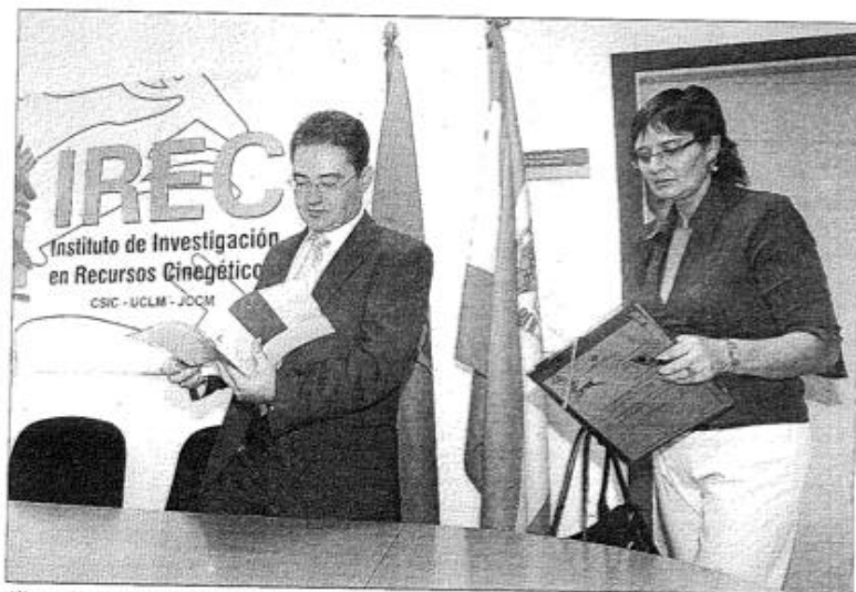
Alia y Jordán se disponen a comenzar su rueda de prensa en el IREC.

Jordán destacó que durante el curso se abordarán las políticas de